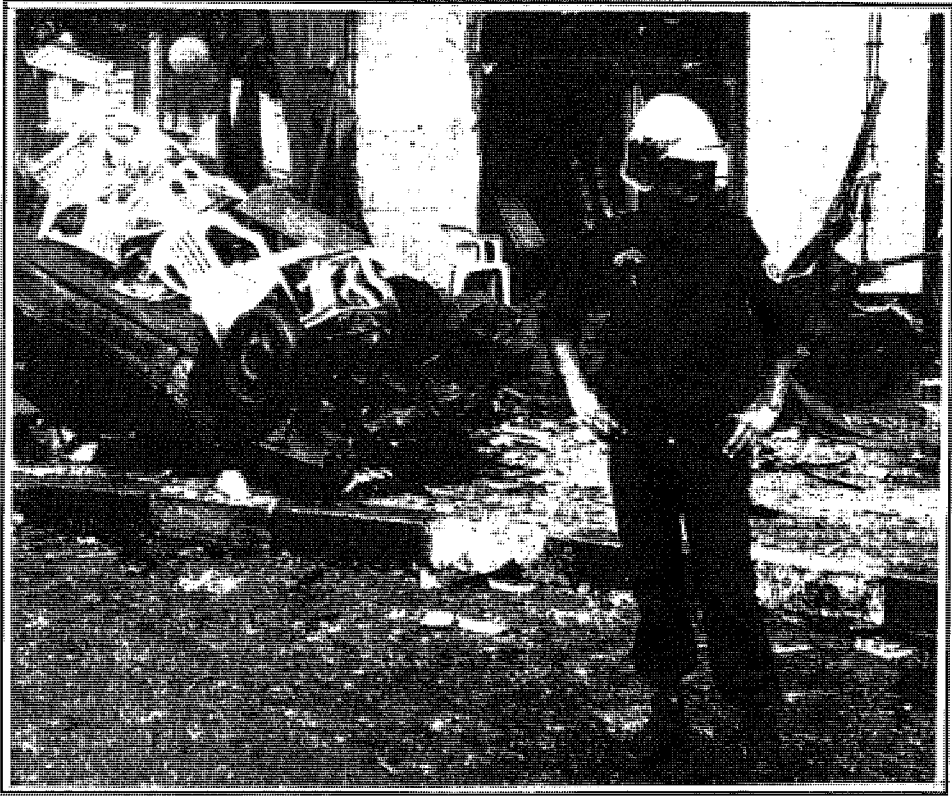
آثار انفجار أصولي في الجزائر

إلى المجلس الدستوري المكلف إعلان شغور سدة الرئاسة ما يلي: «إنه لا يهرب من المسؤولية لكنه اختار سبيل المصلحة العليا للأمة».